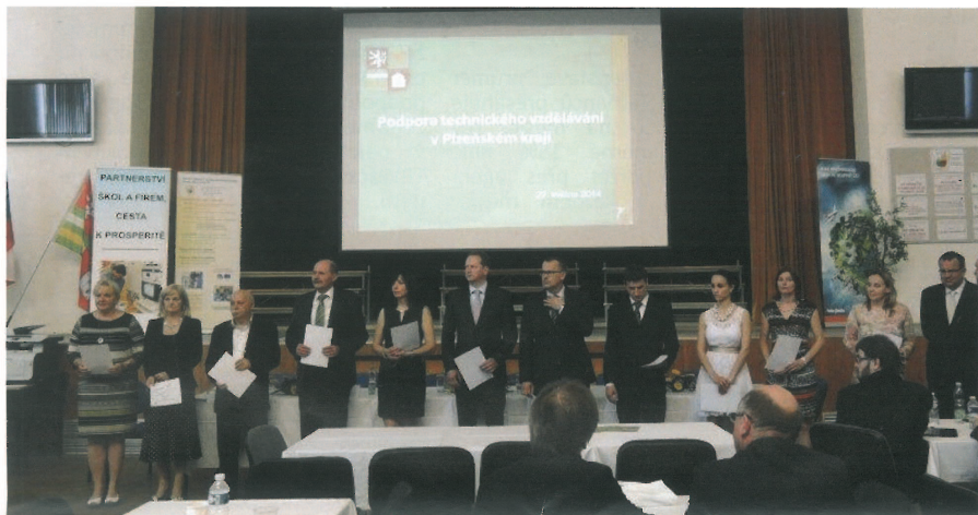
Ve Středočeském kraji získaly cenu ministra průmyslu a obchodu pouze dvě společnosti – Škoda Auto a TRW Autoelektronika.

I v době poměrně vysoké nezaměstnanosti společnosti těžko hledají vhodné kandidáty pro celou řadu pracovních pozic. Na trhu chybí především lidé s technickým vzděláním. Remeslníci, technici, mechanici a pracovníci informačních technologií.