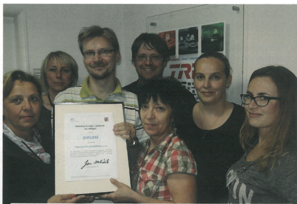
Dne 22. května 2014 TRW Autoelektronika, s. r. o. získala z rukou ministra průmyslu a obchodu ČR cenu za dlouhodobou a aktivní spolupráci na projektu IQ Industry – Partnerství firem a středních technických škol.

Průzkum ukazuje, že se mění priority firem s tím, jak na trhu roste konkurence, klesají marže a společnosti jsou nuceny zvyšovat efektivitu, produktivitu, snižovat cenu, rychleji inovovat, vytvářet nové služby a ty potom umět prodat. V důsledku toho musí firmy produkovat stejně nebo více s menším počtem lidských zdrojů. To vytváří mnohem vyšší nároky na všechny typy zaměstnanců, kteří musí přistupovat k práci úplně novým způsobem. Manažeri na všech úrovních musí být schopni prosazovat změny, a to nejenom v organizaci, ale i v nákladové oblasti. Zároveň musí mnohem citlivěji pracovat s motivací a angažovaností lidí.