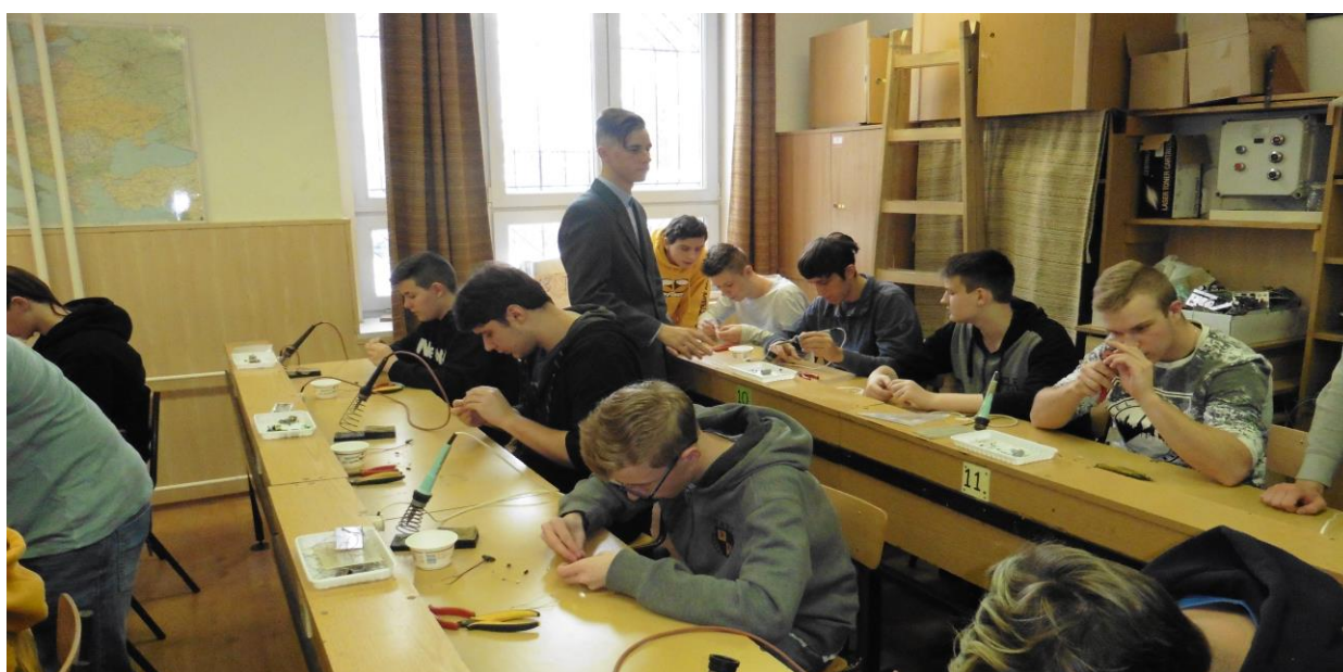
Návštěva odborné školy.