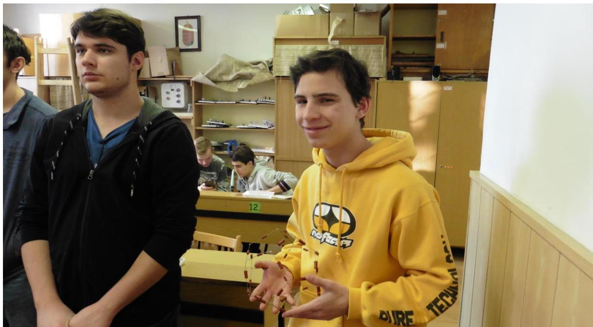
Není nad spokojené žáky.