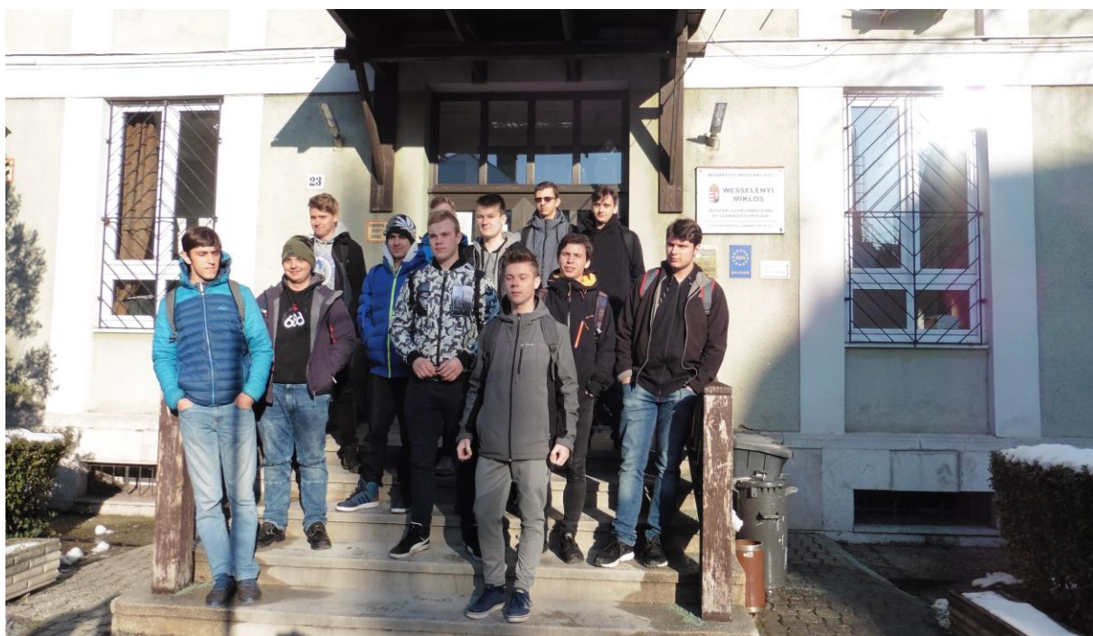
Tentokráte před školou.